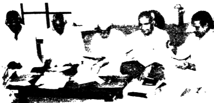
दिनांक १८८९५ से २०८९५ तक सम्पादक मण्डल की बैठक में सम्पादक मण्डल स्मृति ग्रन्थ के वाचना में व्यस्त ।